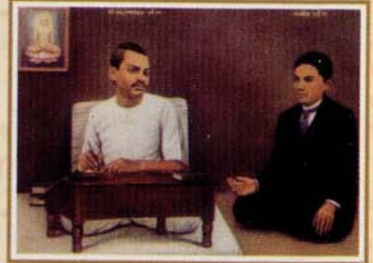
શ્રીમદ્જી અને ગાંધીજી. મુંબઈ. info@jainsite.com