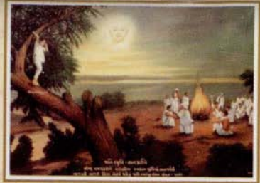
જાતિસ્મૃતિ જ્ઞાન. વવાણિયા