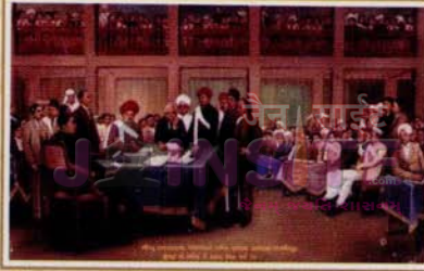
શતાવધાનના પ્રયોગ. મુંબઈ