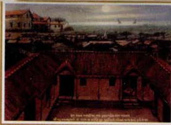
જન્મ સ્થળ. વવાણિયા